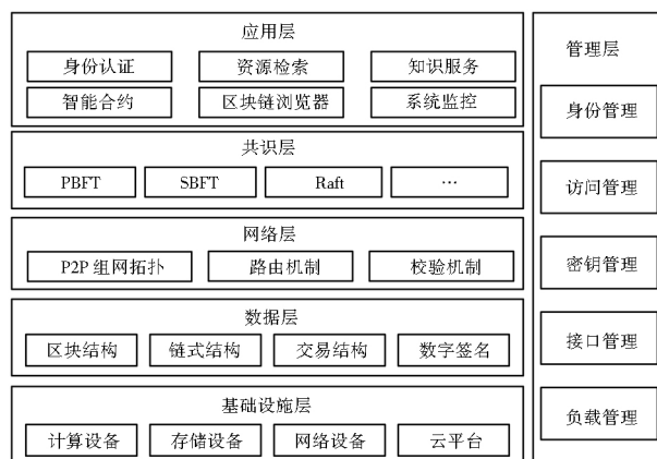
图2 基于区块链的数字图书馆体系架构

数字资源的互操作性和可信性,提高数字图书馆可扩展性和服务质量。基于此,笔者基于区块链技术设计了一种独立自主、分层管理的新型数字图书馆体系架构,如图2所示: